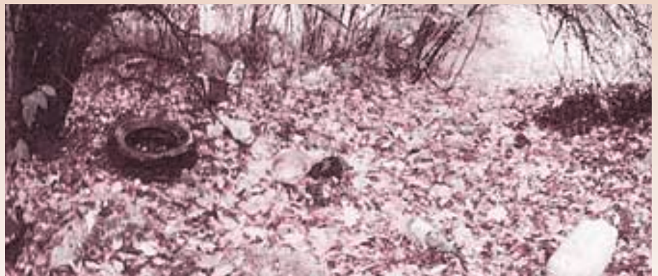
Miesto, kde by sa mal stavať Hospic u Bernadety - Dom pokoja a zmiernosti v Nitre