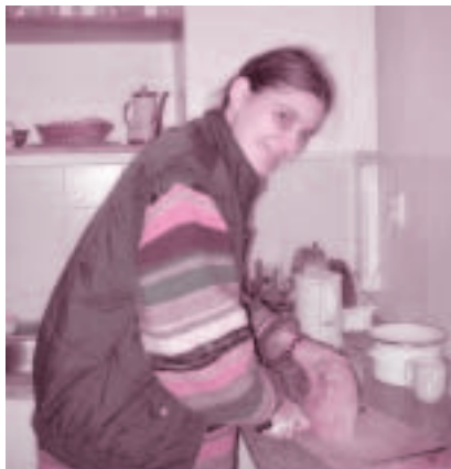
Sociálna pracovníčka z CHSC v Bratislave

pre verejnosť v rámci týchto zariadení: Dom Charitas sv. Jozefa v Spišskej Novej Vsi, Dom Charitas sv. Damiána de Veuster v Spišských Vlachoch, Dom Charitas sv. Kláry v Liptovskom Mikuláši, Dom Charitas Svätej rodiny v Jánov-