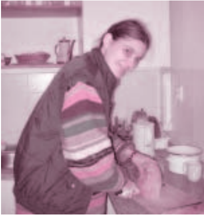
Sociálna pracovníčka z CHSC v Bratislave

pre verejnosť v rámci týchto zariadení: Dom Charitas sv. Jozefa v Spišskej Novej Vsi, Dom Charitas sv. Damiána de Veuster v Spišských Vlachoch, Dom Charitas sv. Kláry v Liptovskom Mikuláši, Dom Charitas Svätej rodiny v Jánov-