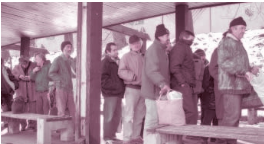
Rad na polievku

Kontakt: Charitatívno-sociálne centrum, Heydukova 12, 811 08 Bratislava, tel.: 02/5296 2712