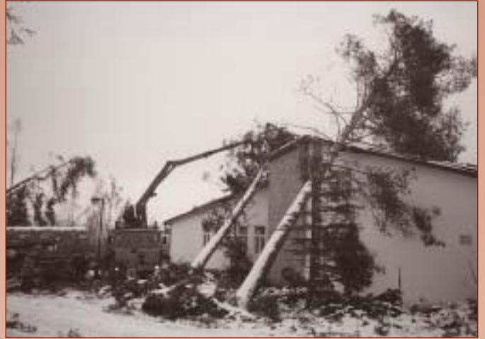
CHD bezprostredne po novembrovej víchrici.

Každý, kto túži prežiť dovolenku v pokojnom prostredí krásnej tatarskej prírody. Sme jedným z mála zariadení v Tatrách, kde okrem oddychu a pohody možno získať aj duchovný pokoj. V kaplnke, ktorá je súčasťou domu, býva každý deň sv. omša a spoločné modlitby nás, sestier. Ubytova-