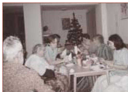
Štedrá večera pacientov a personálu Hospicu Matky Terezy.

Na Štedrý deň priniesli do Hospicu Matky Terezy v Bardejove skauti betlehemske svetlo. Súčasťou sviatočného dňa bola aj spoločná večera klientov a personálu, po ktorej sa rozdávali darčeky. Na Štefana prišli koledníci z Bardejovskej Novej Vsi, 27. 12. 2004 bolo pripravené pásmo piesní, ktoré priniesli ako dar deti z Dlhej Lúky. Vianočný program detí zo Stebnickej Huty potešil všetkých o deň neskôr. Na Nový rok sa uskutočnil vianočný koncert detstského speváckeho zboru Svetielko z Bardejova. Vianočnú at-