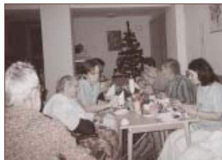
Štedrá večera pacientov a personálu Hospicu Matky Terezy.

Na Štedrý deň priniesli do Hospicu Matky Terezy v Bardejove skauti betlehemske svetlo. Súčasťou sviatočného dňa bola aj spoločná večera klientov a personálu, po ktorej sa rozdávali darčeky. Na Štefana prišli koledníci z Bardejovskej Novej Vsi, 27. 12. 2004 bolo pripravené pásmo piesní, ktoré priniesli ako dar deti z Dlhej Lúky. Vianočný program detí zo Stebnickej Huty potešil všetkých o deň neskôr. Na Nový rok sa uskutočnil vianočný koncert detstského speváckeho zboru Svetielko z Bardejova. Vianočnú at-