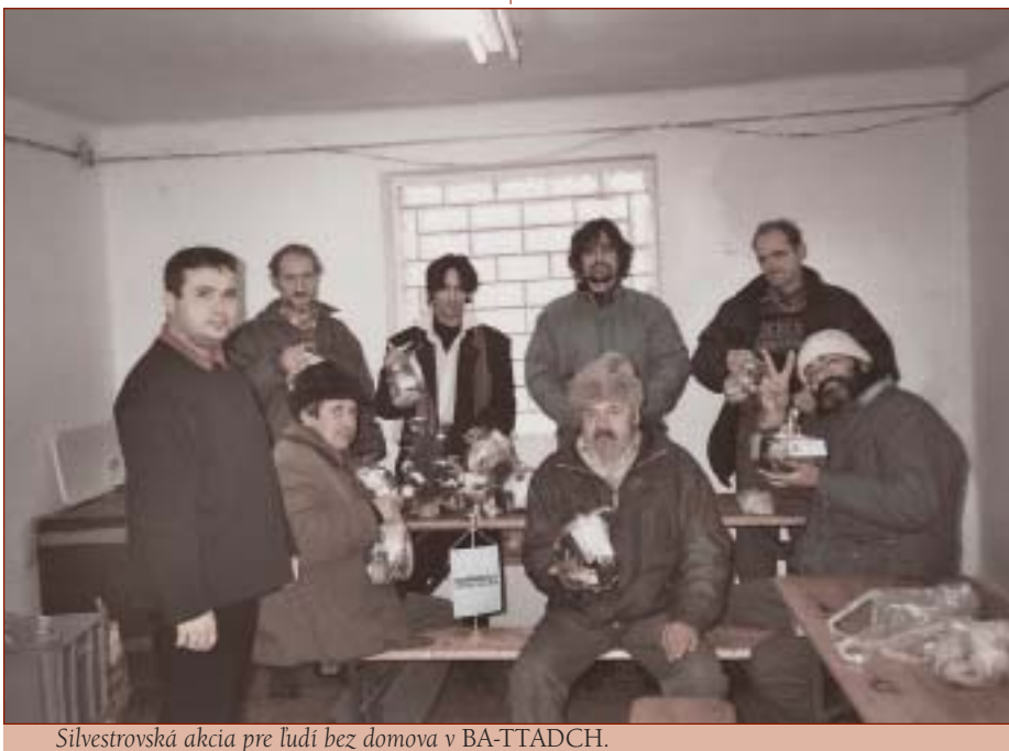
Silvestrovská akcia pre ľudí bez domova v BA-TTADCH.

Charitatívno-sociálne centrum (CHSC) Zvolen pripravilo v zvolenskom kine Mier na Štedrý deň pre 30 bezdomovcov sviatočný obed. Pozostával z tradičnej kapustnice, ryby, zemiakového šalátu, záskuskov a ovocia. Pri príprave a podávaní obeda pomáhali charitným pracovníkom dobrovoľníci.