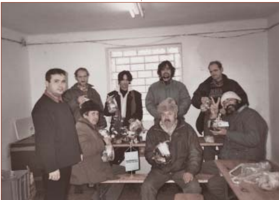
Silvestrovská akcia pre ľudí bez domova v BA-TTADCH.

Zvolen pripravilo v zvolenskom kine Mier na Štedrý deň pre 30 bezdomovcov sviatočný obed. Pozostával z tradičnej kapustnice, ryby, zemiakového šalátu, záskuskov a ovocia. Pri príprave a podávaní obeda pomáhali charitným pracovníkom dobrovoľníci.