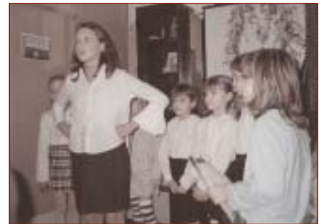
Vystúpenie detí 8. základnej školy v Michalovciach počas trojkraľového popoludnia

Vianočný čas nás zblížuje. Otvárame svoje srdcia a snažíme sa podať pomocnú ruku ľuďom, ktorí sú na ňu odkázaní. Niekrorí z nás pomáhajú materiálne, iní modlitbou, milým slovom, či pohladením. Vďaka pracovníkom