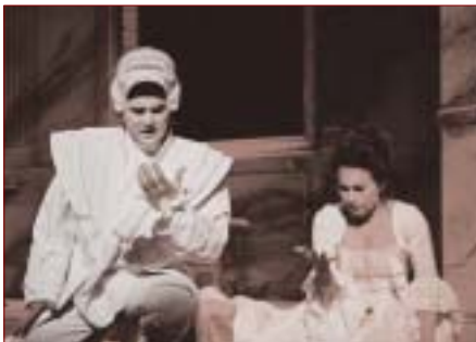
Don Giovanni, SND Bratislava