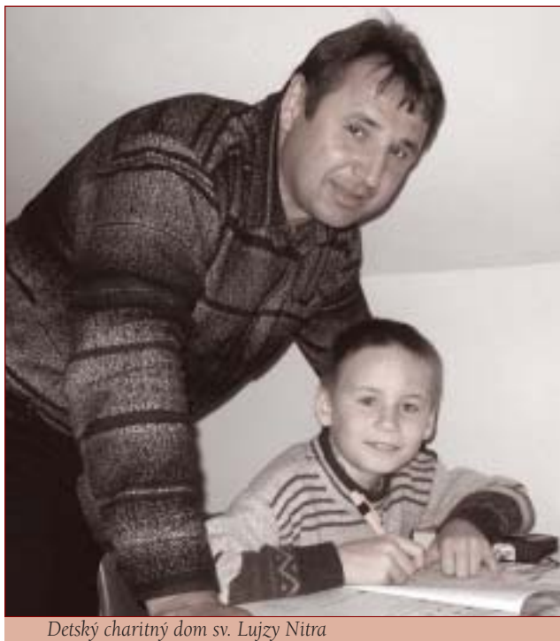
Detský charitný dom sv. Lujzy Nitra

nie osamelým rodičom s deťmi v útulkoch a krízových centrách.