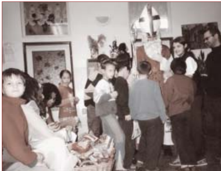
Sv. Mikuláš v DCHD Nitra

Dom Charitas sv. Jozefa v Spišskej Novej Vsi sa ako šibnutím čarovného prútika zmenil na dúhový svet. Vianočná výzdoba na nás dýchla už pri vstupe. Ligot pestro-