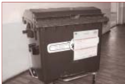
Slávnostné vylepenie prvého kontajnera v priestoroch nocľahárne pre bezdomovcov Depaul

Začiatkom marca sme odštartovali v rámci tohto roka neobvyklú komunikačnú kampaň. Po celej Bratislave bolo vylepených vyše 6000 nálepiek na kontajnery s komunálnym odpadom. Nálepky poskytujú informácie o pomoci pre ľudí ohrozených chudobou ako i pre tých, ktorí chcú týmto ľuďom pomôcť. Napríklad bezdomovci sa môžu dozvedieť, ako sa stať predajcom časopisu Nota Bene a kde v Bratislave sa nachádzajú výdajne jedla. Na nálepkách je uvedené telefónne číslo, kam môžu ľudia volať, ak nájdu človeka v núdzi a adresa neziskovej organizácie Depaul Slovensko. V jej priestoroch sa uskuotočňujú zbierky oblečenia, jedla a hygienických potrieb pre ľudí bez domova. Nezisková organizácia Depaul im zároveň ponúka miesto, kde môžu prespať.