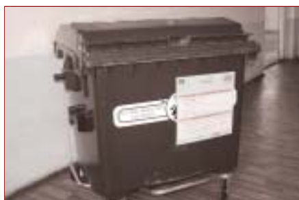
Slávnostné vylepenie prvého kontajnera v priestoroch nocľahárne pre bezdomovcov Depaul

Začiatkom marca sme odštartovali v rámci tohto roka neobvyklú komunikačnú kampaň. Po celej Bratislave bolo vylepených vyše 6000 nálepiek na kontajnery s komunálnym odpadom. Nálepky poskytujú informácie o pomoci pre ľudí ohrozených chudobou ako i pre tých, ktorí chcú týmto ľuďom pomôcť. Napríklad bezdomovci sa môžu dozvedieť, ako sa stať predajcom časopisu Nota Bene a kde v Bratislave sa nachádzajú výdajne jedla. Na nálepkách je uvedené telefónne číslo, kam môžu ľudia volať, ak nájdu človeka v núdzi a adresa neziskovej organizácie Depaul Slovensko. V jej priestoroch sa uskuotočňujú zbierky oblečenia, jedla a hygienických potrieb pre ľudí bez domova. Nezisková organizácia Depaul im zároveň ponúka miesto, kde môžu prespať.