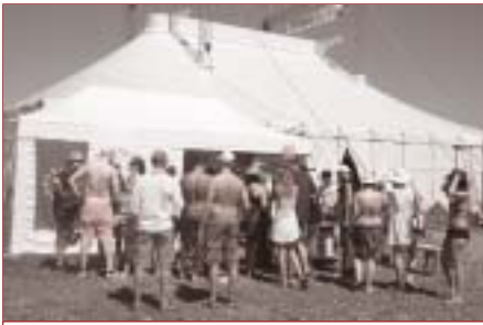
Účastníci Bažant Pohoda festivalu pred stanom EÚrôpa