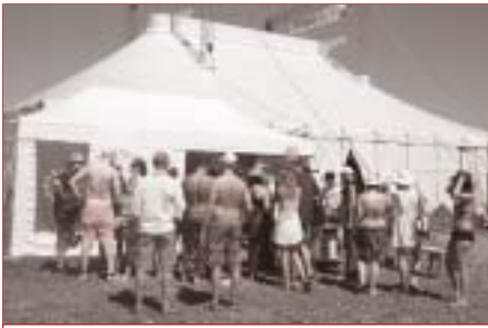
Účastníci Bažant Pohoda festivalu pred stanom EÚrópa