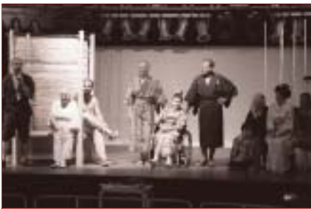
Herci z Divadla bez domova počas diskusie stanom EÚrópa

V júli tohto roku sa opäť otvorili brány najväčšieho slovenského festivalu Bažant Pohoda. A na ňom sme nechýbali ani my. Zastúpenie Európskej komisie bolo jedným z partnerov festivalu a vo svojom európskom cirkusovom šapitó prinieslo množstvo zaujímavých vystúpení, diskusií a koncertov. Prezentáciou našich aktivít na festivale Bažant Pohoda sme chceli upriamiť pozornosť najmä mladých ľudí na vážne spoločenské fenomény ako je chudoba a sociálne vylúčenie, chceli sme rozprúdiť diskusiu, ale tiež sa dobre zabaviť. V našom stane nazvanom EÚrópa sme dali priestor tým, ktorých sú často krát vytláčani na okraj spoločnosti. Návštevníci festivalu si mohli pozrieť predstavenia hercov s mentálnym a zdravotným postihnutím z Divadla z pasáže. Bokom neostali ani tí, ktorí nemajú vlastnú strechu nad hlavou. Herci - bezdomovci z Divadla bez domova nám ukázali, že ani neľahká životná situácia nemôže zničiť ich túžbu vrátiť sa späť do normálneho života. Divadlo okrem práce s marginalizovanými skupinami obyvateľstva pomáha spájať rôzne pohľa-