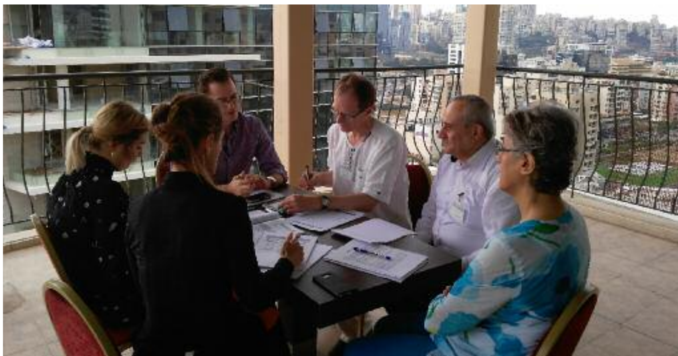
Školenie prebiehalo aj v malých pracovných skupinách. Jedným z obľúbených miest na stretnutie bola terasa na streche hotela