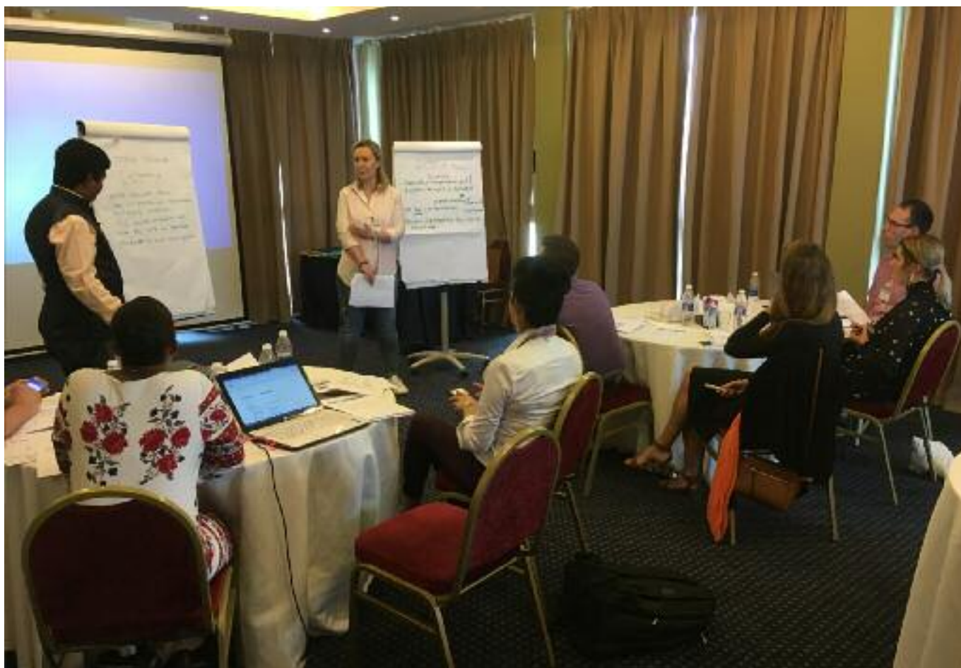
Súčasťou školenia boli aj interaktívne prednášky, ktoré udržiavali našu pozornosť

Ján Michalský, Hugo Gloss foto: Ján Michalský, Hugo Gloss