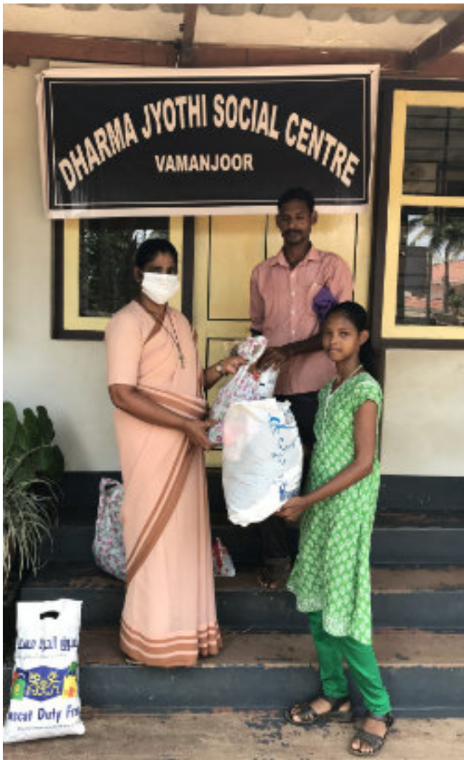
Sestra Joel pri distribúcii potravín chudobným rodinám