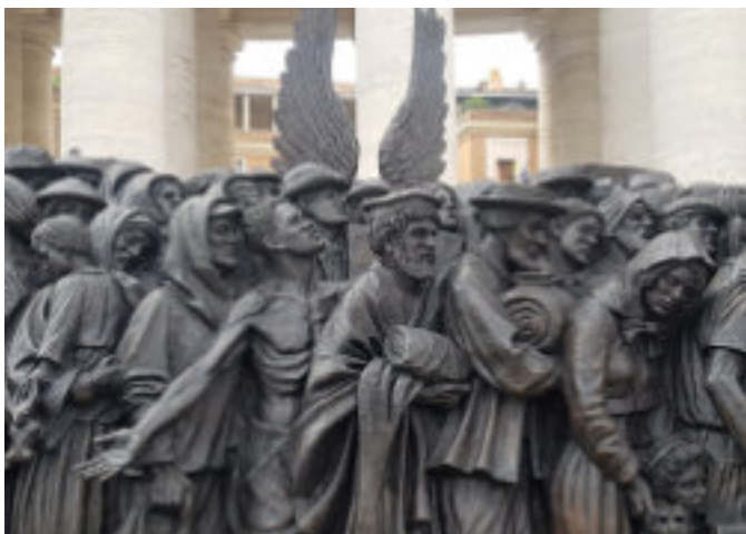
Kardinál Czerny upozorňuje na previazanosť migrácie a otroctva, pretože mnohí migranti sa stávajú obeťmi obchodníkov s ľuďmi.

Plastika zobrazujúca migrantov a utečencov Angels Unawares, v preklade Nevedomí anjeli, sa stala inštaláciou, ktorá po 600 rokoch ako prvá v roku 2019 doplnila vatikánske námestie. Podobne ako socha obetí obchodovania s ľuďmi, vznikla aj táto na objednávku kardinála Michaela Czerneho, ktorého starí rodičia emigrovali z rodného ČSR v úteku pred komunizmom. Ich tváre nájdete aj medzi zobrazenými postavami. Šesť metrov dlhá socha zobrazuje migrantov z rôznych období a kultúr, a tak poukazuje na to, že migrácia nie je krízou, ale súčasťou histórie ľudstva. Zdieľa silné posolstvo o ľudskej skúsenosti s migráciou, ktorá nám dovolila prežiť, hoci túto skúsenosť odmietame tým, ktorí sa podobne snažia zachrániť.