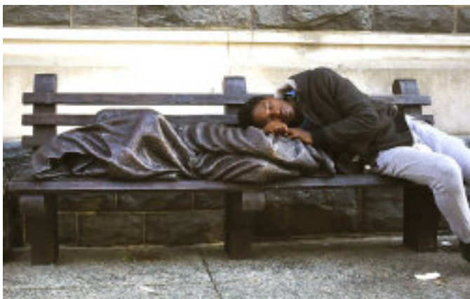
Socha Homeless Jesus.