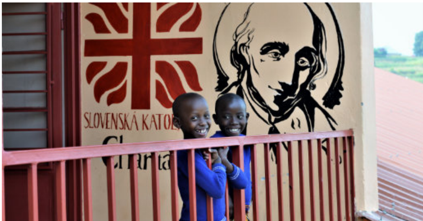
Škôlkari v rwandskom centre Kultúrne centrum sv. Vincenta Pallotti pre deti narodené do veľmi chudobného prostredia.