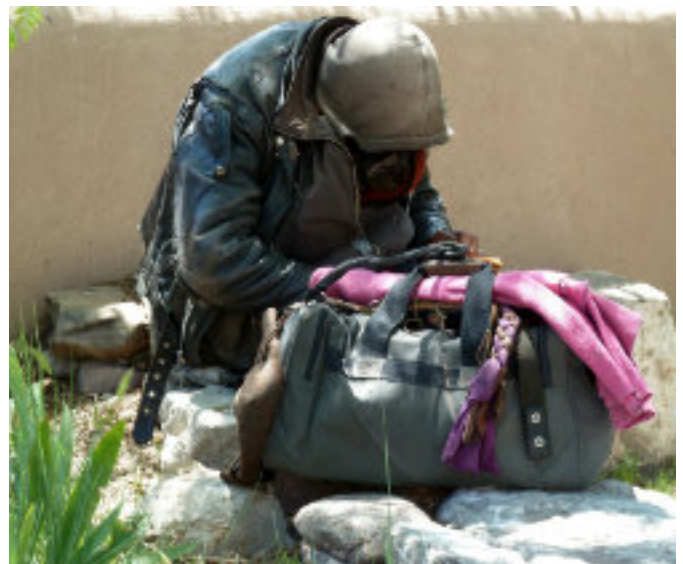
Na ulici v Trnave žije momentálne takmer 160 ľudí.

Pomôcť ľuďom v takýchto situáciách je beh na dlhé trate. Niektorí sa z ulice dostanú po rokoch, iní to nemusia dokázať vôbec. U nás, na Charite, nájdú však pomoc vždy, keď o ňu požiadajú. Hoc aj po sty ráz alebo po tom, čo pomoc odmietli.