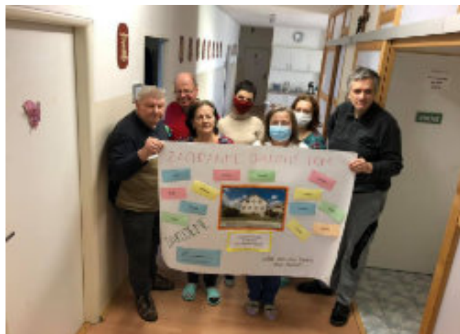
Klienti a zamestnanci Charitnému domu sv. Edity Steinovej vo Vojčiciach